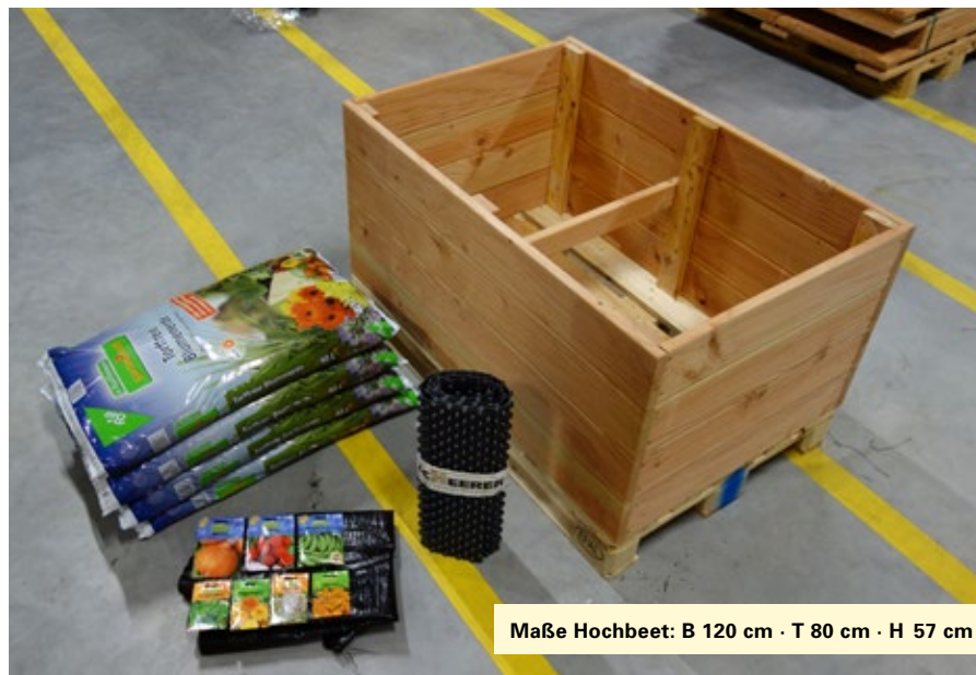
Maße Hochbeet: B 120 cm · T 80 cm · H 57 cm

Hochbeet nach Aufbau inklusive mitgelieferter Materialien